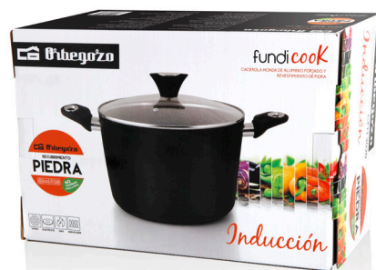
CAJA DE CARTÓN