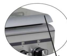
Tapa cristal con PERFIL FRONTAL ALUMINIO