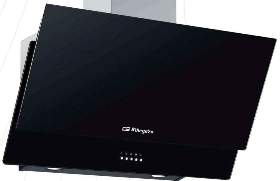
DS 74170 N