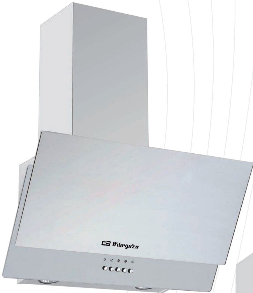
DS 74160 BL