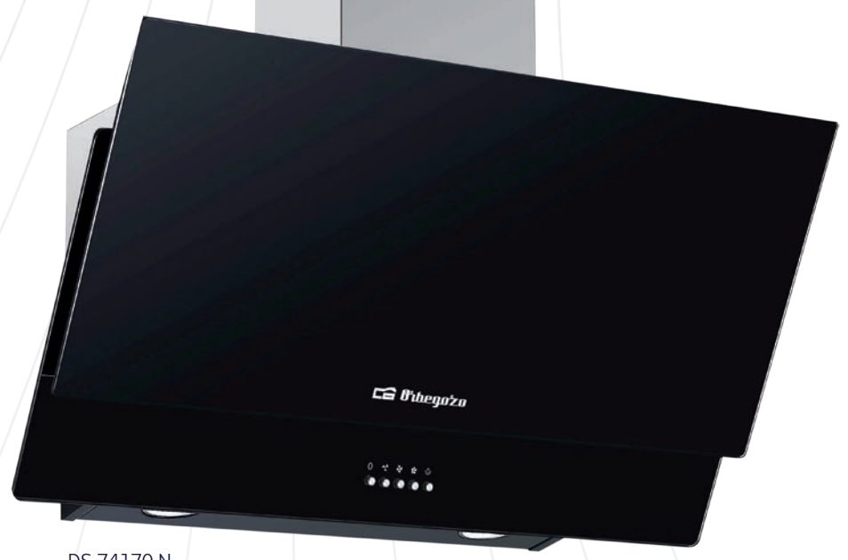
DS 74170 N