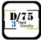
Núcleo Vita Plus