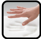
Viscoelástica alta densidad